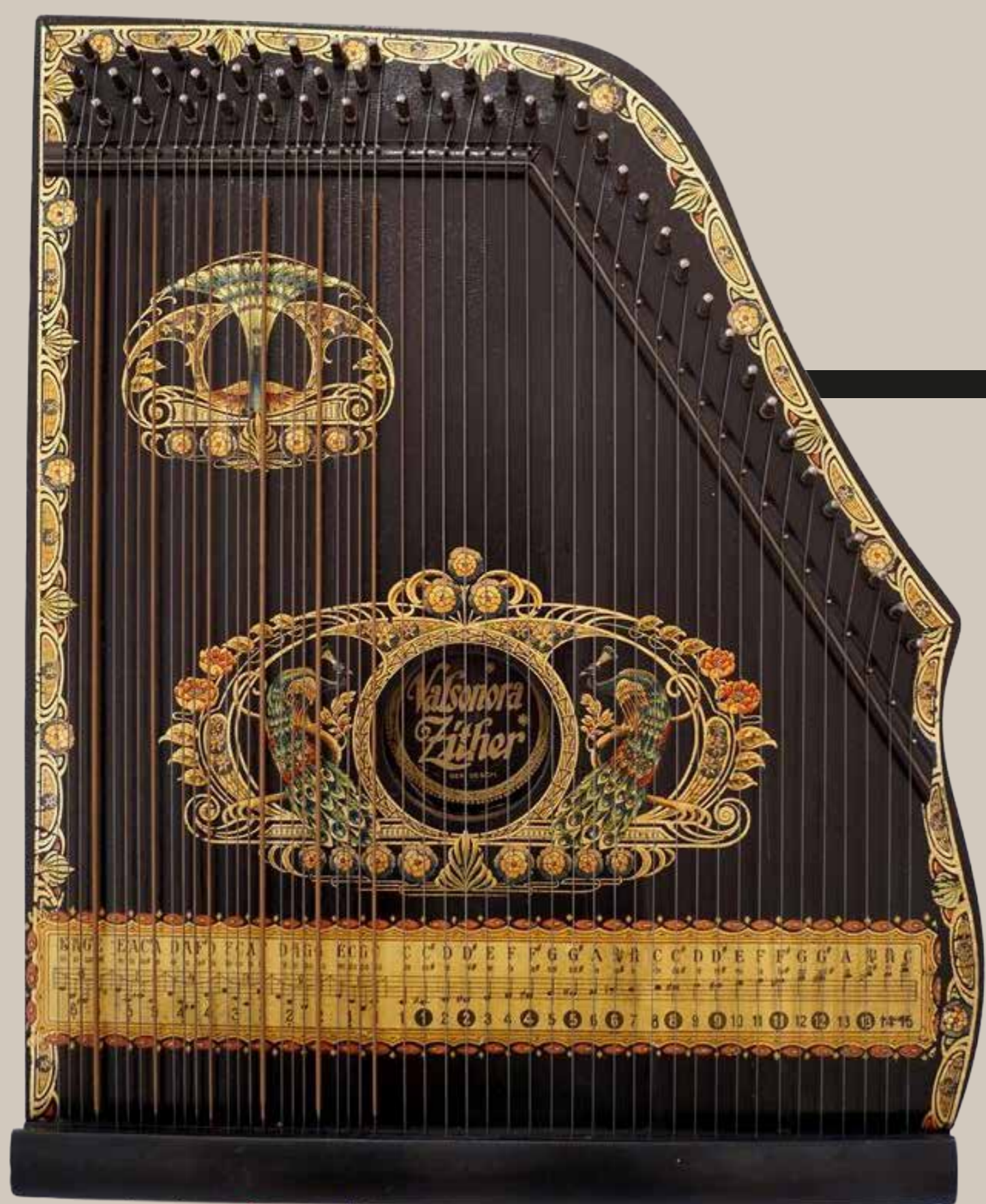
Cytra akordowa Valsnora Zither Niemcy XIX/XX w.