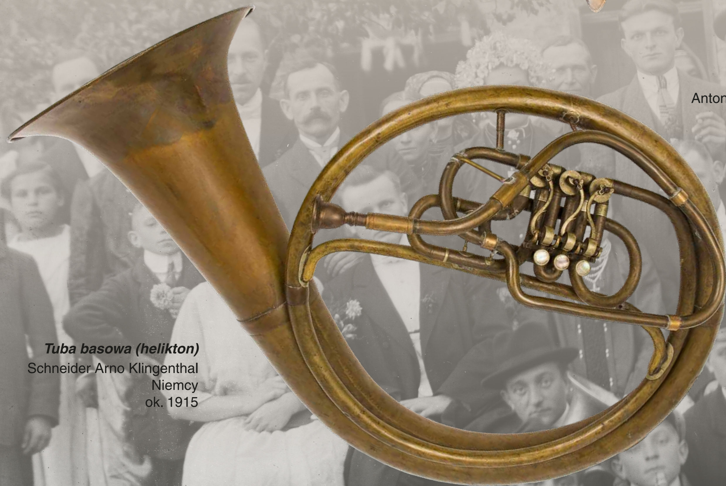
Tuba basowa (helikton) Schneider-Arno Klingenthal Niemcy ok. 1915