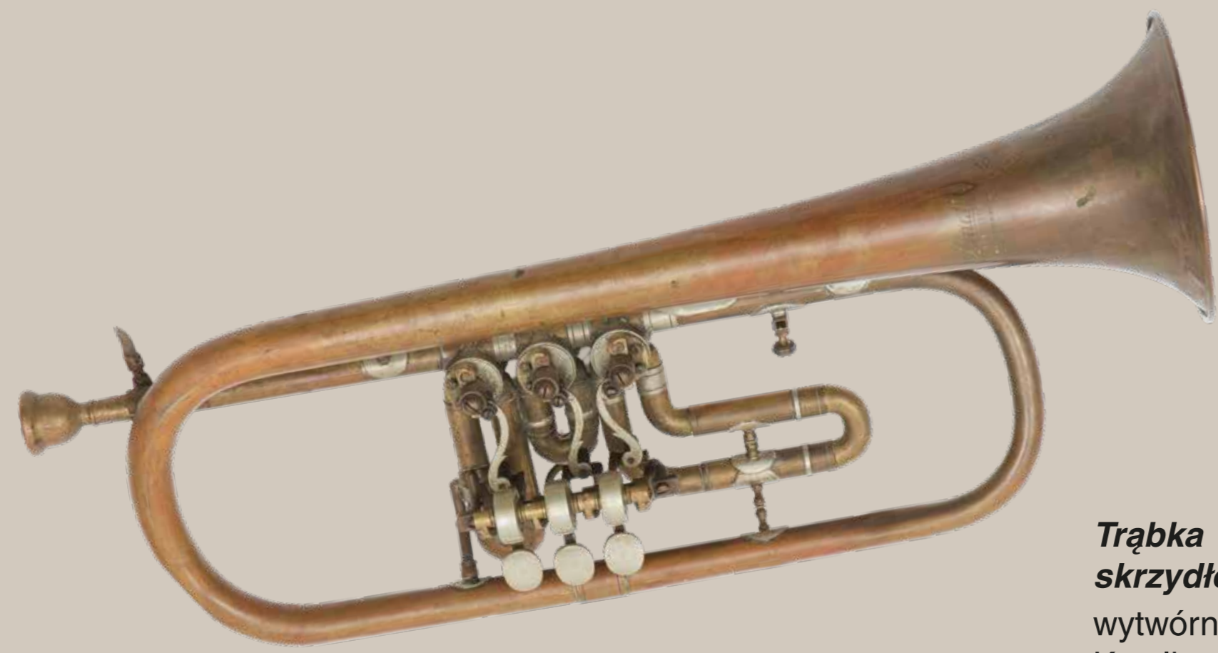
Trąbka skrzydłówka wytwórnia Amati Kraslice 1. poł. XX w.